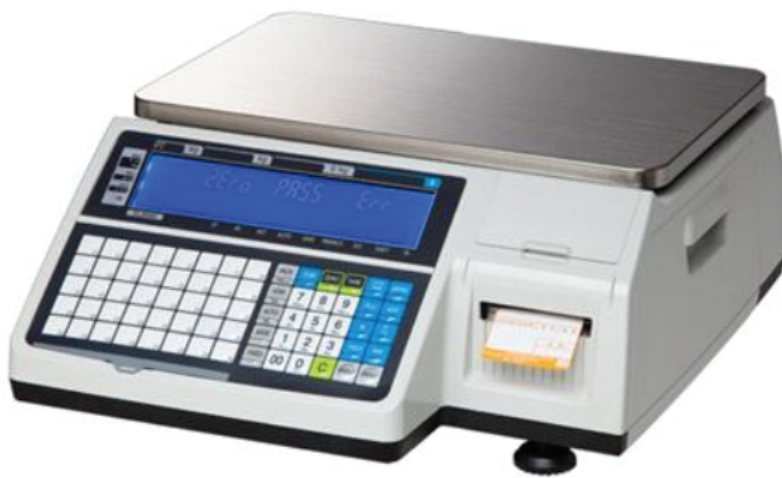
SENIOR CAS1 (SNS-CL5200B) แบบไม่มีเสา

เครื่องชั่งคำนวณราคามีปริ้นสติกเกอร์ในตัว ซึ่งโปรแกรมเป็นภาษาไทยและยังสามารถปริ้นเป็นภาษาไทย พร้อมทั้งสามารถออกแบบสติกเกอร์ได้เอง และสามารถเชื่อมต่อกับโปรแกรมได้ทั้งแบบผ่านสาย และ ไร้สาย