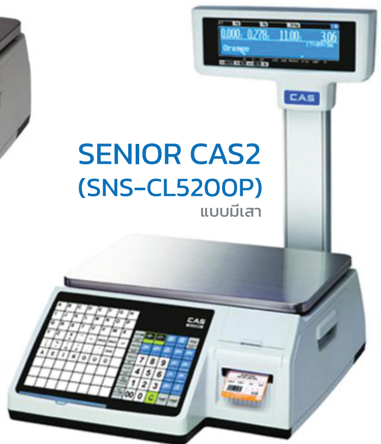
SENIOR CAS2 (SNS-CL5200P) แบบมีเสา